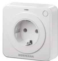
Рис. 4: Система ДУ Hörmann BiSecur была расширена дополнительными функциями: с лета 2015 производитель ворот и дверей предлагает внутренний клавишный выключатель и приемник в розетке, при помощи которых возможно управление не только приводами

Загрузить тексты и картинки: www.hoermann.de/presse