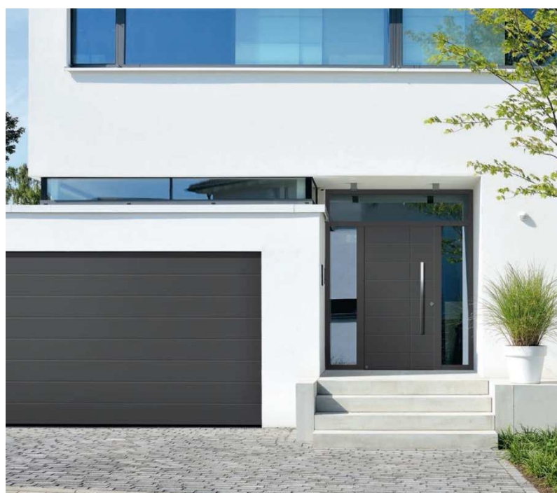
Рис. 2: Алюминиевые входные двери ThermoSafe от Hörmann с особенно хорошей теплоизоляцией и защитой от взлома поставляются с лета 2015 с новыми мотивами с канавками и остеклением.

Hörmann KG Verkaufsgesellschaft Двери · Ворота · Электроприводы